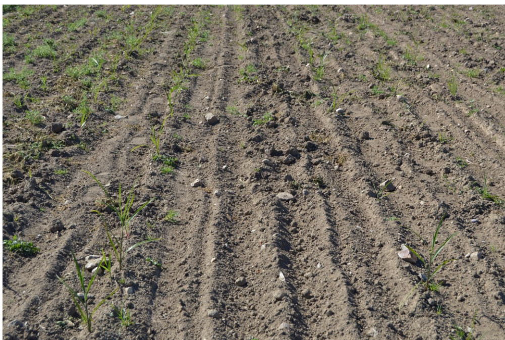
Billede 9. Barrodsplanter med 70 procent succes 2 uger efter plantning.

I juni 2014 blev projektets første mark etableret hos landmand Carl Ejner Baastrup i Låsby vest for Aarhus. I alt 1,6 hektar blev tilplantet, fordelt på to marker: På den ene er der anvendt godkendte pesticider til ukrudtsbekæmpelse, på den anden er der udelukkende brugt mekanisk bekæmpelse af ukrudt – i en kombination mellem hakning, radrensning, strigling samt fræsning. Samtidig er der under den ene af de to marker udlagt såkaldte sugeceller af Institut for Agroøkologi, Aarhus Universitet, for at få målinger af udvaskning af næringsstoffer fra marken.